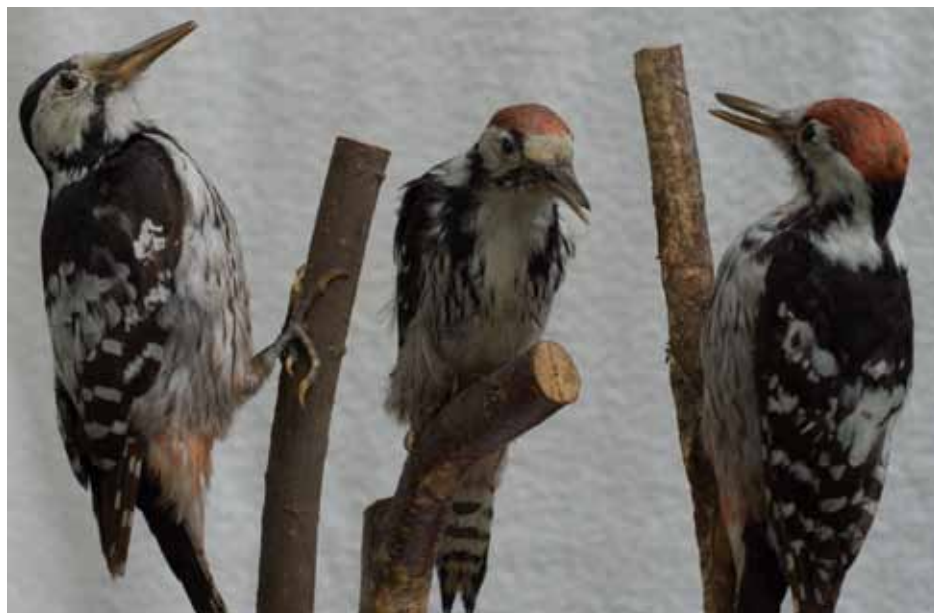
Vitryggig hackspett.

Alla uppgifter kring växterna finns åtkomliga från museets hemsida www.bimon.se . Söksidan hittar man under Växter -> Databaser -> Sök i databas eller enklare från länken Sök i OHN som återfinns längst upp till höger på startsidan. Vi deltar i projektet Sveriges virtuella herbarium och våra uppgifter anpassas successivt så att de blir åtkomliga även från nätplatsen Virtuella Herbariet ( www.herbarium-ume.se/virtuella_herbariet/ ).