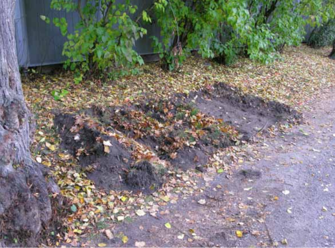
Delvis återfyllt hål på den gamla växtplatsen.

2012 fick kommunen dispens att flytta ungefär en tredjedel av beståndet. Planeringen drog ut på tiden, men hösten 2013 genomfördes slutligen flytten. Hela sjok med mer eller mindre intakt vegetation grävdes upp med traktorgrävare och flyttades till slänten mot Olof Palmes gata, knappt 100 m söder om den ursprungliga växtplatsen. Vegetationssjok från planteringshålen användes för att fylla hålen efter luddvårloken.