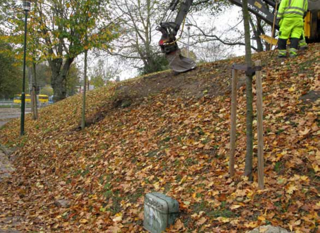
Den nya växtplatsen vid Olof Palmes gata.

ytor som inte påverkats av flytten. I den slänt dit delar av beståndet flyttades har jag inte lyckats hitta någon blommande planta. Dock har jag sett en del blad som kan vara luddvårlök. Vårlök Gagea lutea och dvärgvårlök G. minima som troligen följde med i flytten har däremot blommat.