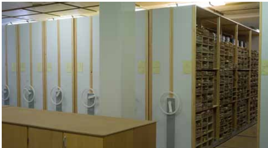
De nya lokalerna.

De botaniska samlingarna räknar i skrivande stund 237 000 registrerade objekt. Huvudparten, 214 000 objekt utgörs av kärlväxter, följt av ca 19 000 mossor. Majoriteten av växterna, närmare 210 000 kommer från Sverige, antalsmässigt följt av Norge, Österrike och Frankrike.